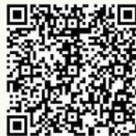
第一梯次報名表單